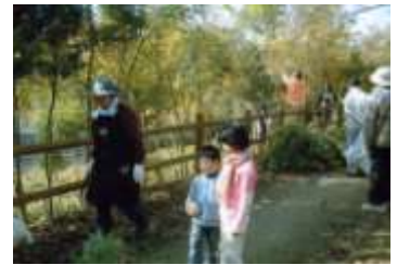
メンテナンス大会→

このモデル地域を礎に、地域の方々をはじめ、河川にかかわるいろいろな方々と一緒に「地域と共生できる、より良い朝倉川」をつくっていくきっかけになることを期待しています。