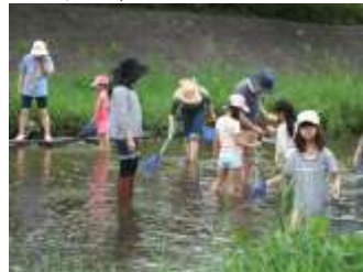
<河川調査: 生き物観察>