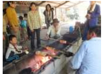
<バームクーヘン作り>