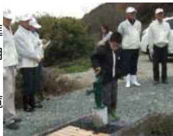
<ご寄贈いただいた井戸>

そのほか今回の解体では、作業小屋の後ろにはコンクリート製の大きな浄化槽があったり、地面の下を通過して水が引かれた貯水槽があって、鯉が棲んでいたという発見もありました。浄化槽は解体しましたが、貯水槽はそのまま鯉と一緒に残し東ライオンズさんからのご寄付による手漕ぎポンプを設置し、手洗い場を作りました。今のところは「車を停めるところが増えて便利になったなあ」くらいですが、今後は植樹などを行って整備を進めながら広がった部分の活用方法についても検討していきたいと思います。まだご覧になっていない方は是非ビオトープに足を運んでもらい