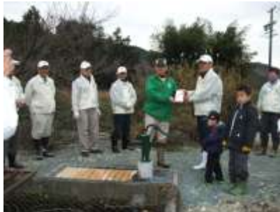
<ご寄贈の井戸贈呈式>

トイレの周辺の建物がなくなって トイレがちょっと使いづらくなっ ていましたので、その前に竹垣を 作っていただきました。